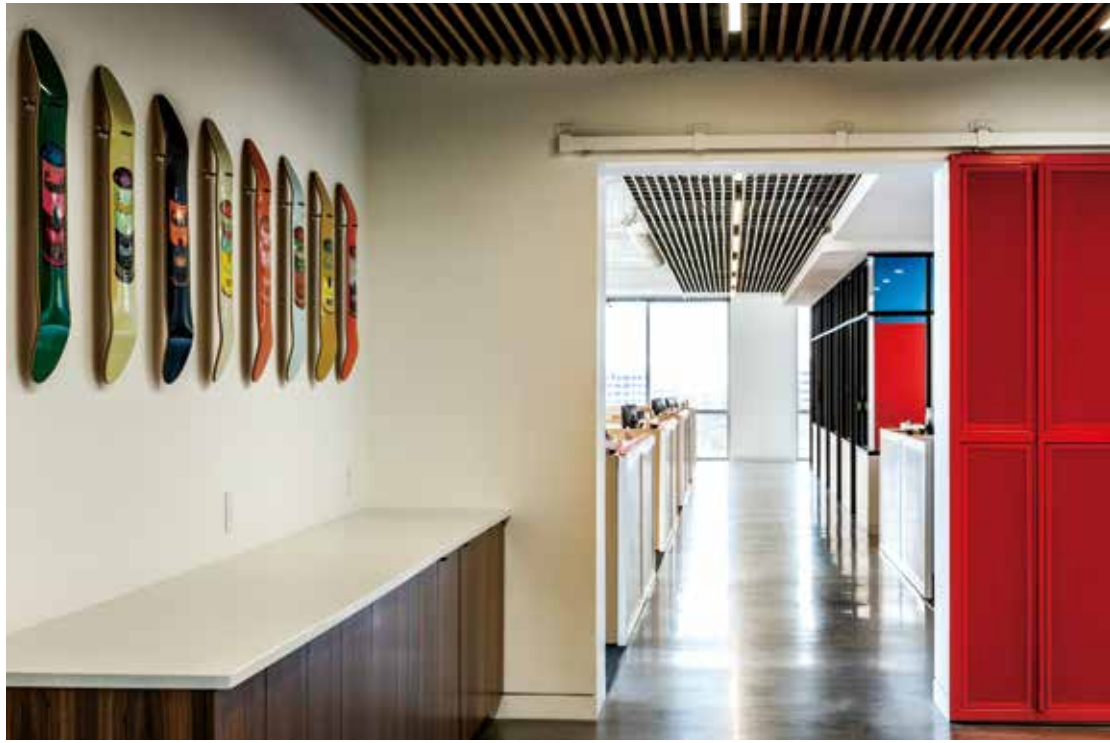
로비를 지나 사무공간으로 향하는 복도를 통해 두 개의 대규모 회의장으로 드나들 수 있다. 넓고 쾌적한 회의장에서 직원들과 고객들이 크고 작은 미팅을 진행한다. 대규모 회의장은 차분하면서도 모던한 분위기의 인테리어 디자인으로, 컬러의 활용을 절제하고 기능성과 효율을 중점에 두었다. OFFICIAL의 디자이너가 직접 고른 가구와 소품은 건물 삼면의 넓은 창으로 유입되는 자연광과, 창 밖으로 보이는 Dallas 도심지의 아름다운 경치를 부각시킨다.